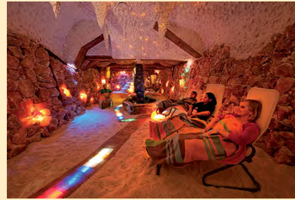
Tief durchatmen im heilsamen Mikroklima der Salzgrotten.

Verbringen Sie ein paar angenehme Tage in Schwäbisch Hall. Moderne Kunst & Alte Meister, Klöster und Burgen, das Solebad mit Saunalandschaft, die Haller Salzgrotten und viele Verwöhnangebote von der Hawaii- oder Schokoladen-Massage bis zu Ayurveda warten auf Sie.