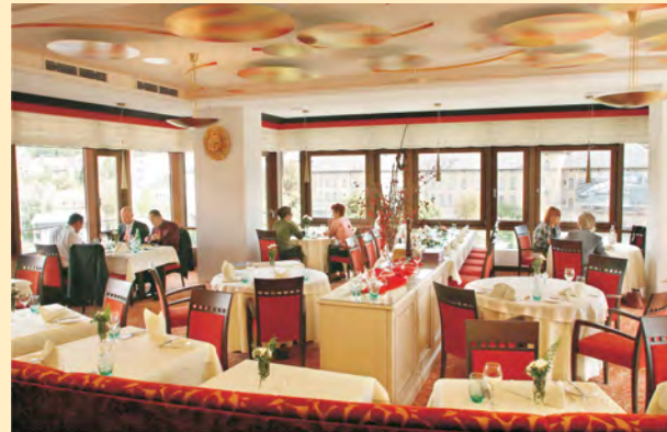
Das Aussichtsrestaurant mit Blick über die Dächer der Altstadt. Ganz oben auf der Speisekarte stehen Spezialitäten der Region.

Abreise spätestens am letzten Geltungstag.