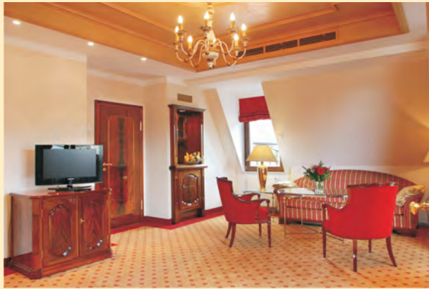
Ganz oben: Wer über Silvester in der Spa Suite, der Fürstlichen oder Königlichen Suite residieren möchte, bitte früh buchen. Preise auf Anfrage.

Erwartungsvolle Vorfreude auf die große Silvestergala, umrahmt von einem abwechslungsreichen Festprogramm – wie gewohnt wird das Hohenlohe-Team zwischen Weihnachten und Drei König einmal mehr zur Hochform auflaufen. Bitte fordern Sie unseren Silvesterprospekt „Sternstunden“ mit allen Highlights und Preisen an.