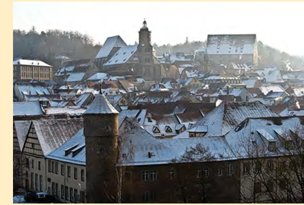
Blick auf St. Michael.

Unser Angebot vom 20.–24.12. &amp; 26.–29.12.2010