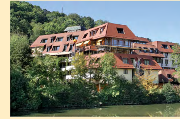
Hotel Hohenlohe am Ufer des Kochers vis à vis der Haller Altstadt.

2 Tage ÜF inkl. HP, Begrüßungscocktail, Beautybehandlung und Ganzkörpermassage ab 322.- € im DZ.