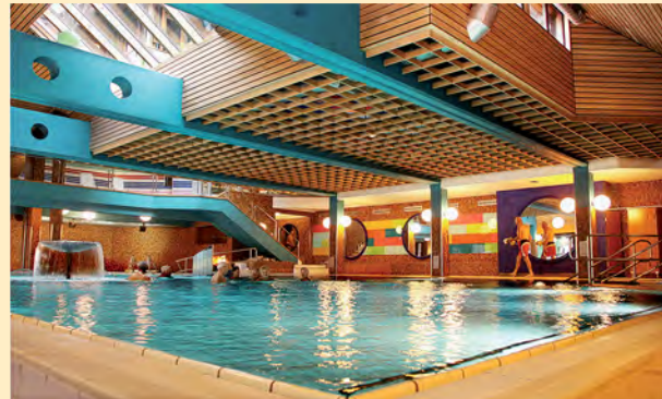
Mehr Licht, Luft und top Wasserqualität – die Schwimmhalle des Solebades auf dem neuesten Stand der Technik nach der Verjüngungskur.

3 oder 6 Tage-Arrangements zum Ausspannen!