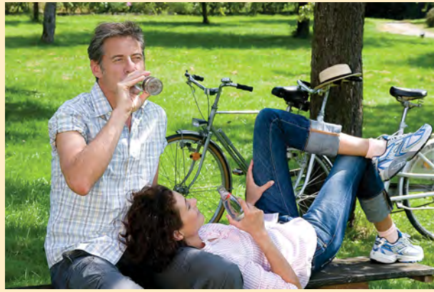
Raus ins Grüne – rein in den Sommer des Urlaubs- und Genießersparadieses Hohenlohe.

Wenn Sie Zeit finden, auch unter der Woche mal kurz entschlossen die Koffer zu packen, dann empfehlen wir einen Abstecher nach Schwäbisch Hall. Neben Freilichtbühne und den Konzerten des Hohenloher Kultursommers bietet die Region reichlich Gelegenheit zum Wandern, Joggen oder Radfahren. Der 328 km lange Kocher-Jagstweg führt direkt unterhalb des Hauses vorbei. Tourentipps finden Sie z.B. unter www.wegpunkt.de