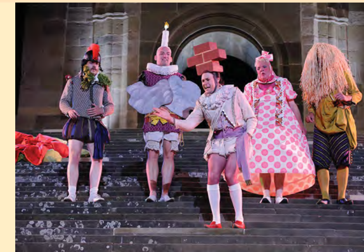
„Ein Sommernachtstraum“ auf der Großen Treppe – Szenenfoto 2009