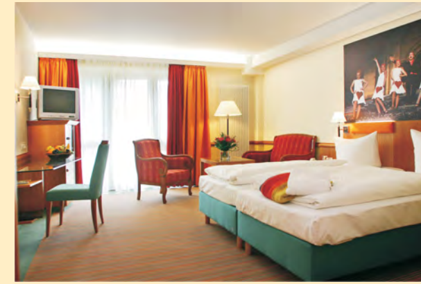
Warme Farben, viel Holz: eines der neuen, klimatisierten Luxus-DZ.

Kennen Sie schon unsere Superior und Luxus Doppelzimmer? In den vergangenen drei Jahren wurden auch die älteren Zimmer komplett umgebaut und mit geräumigen Badezimmern, Balkonen, allergikerfreundlichen Teppichen, neuen Betten und ergonomischen Matratzen ordentlich „aufgemöbelt“.