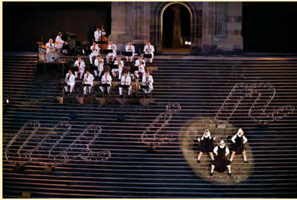
„Glenn Miller“ – der Publikumsrenner 2008 und 2009 wird noch einmal den Marktplatz zum Swingen bringen.